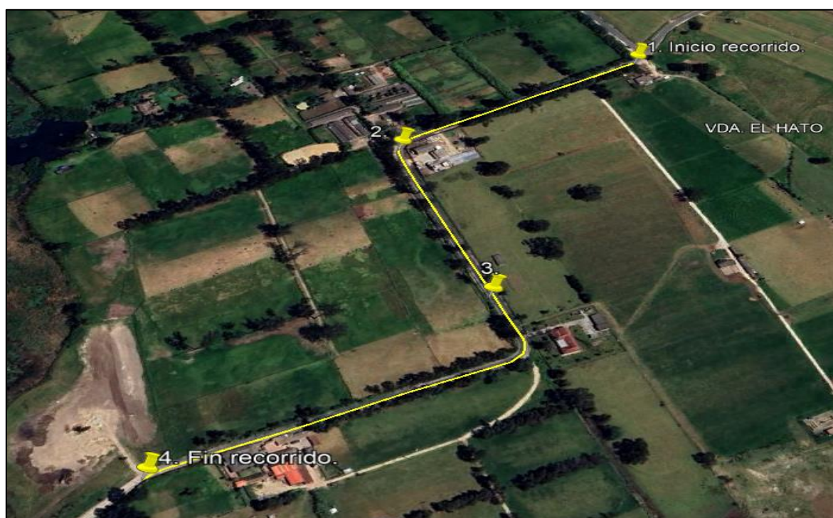
Ilustración 1. Recorrido verificación ambiental – Vereda El Hato

Se realizó recorrido de control y vigilancia de los componentes ambientales en áreas rurales del municipio de Funza, vereda El Hato el día 31 de mayo de 2024, desde las Coordenadas 4°42'46.178"N - 74°10'28.639"W hasta las coordenadas 4°42'24.851"N - 74°10'42.31"W (ver ilustración 1. Ruta amarilla), con el fin de verificar las condiciones ambientales, identificar posibles afectaciones a los recursos naturales y realizar las acciones de prevención correspondientes.